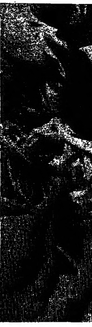
امراة فيتنامية جنوبية تصلي وهي ترفد الموعوم بينما جالس الطفل وقد غطى عينيه فلما انه انه بلكه يحلثي سمع الرصاص الذي كان يملغ في الصلبي من سايفون « تصوير اليونانيديرس »

تونس (ولاية أريزونا) - رويتر - توجه البوليس هنا تيمية القتل غير المتصد الى والدي فاة فبعت قتل... نفسها على قتل كلبها كعقاب لها على نضبة الليل في الخارج مع رجل.